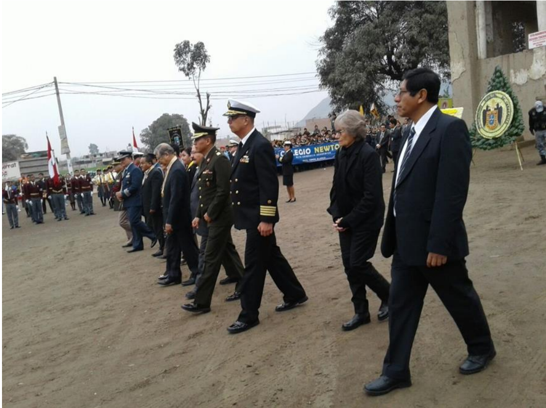
Punchauca, 2 de junio de 2017. Conmemoración del encuentro entre el libertador José de San Martín y el virrey José de la Serna.